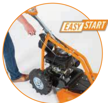
AS dvotaktni motor sa EasyStart sistemom